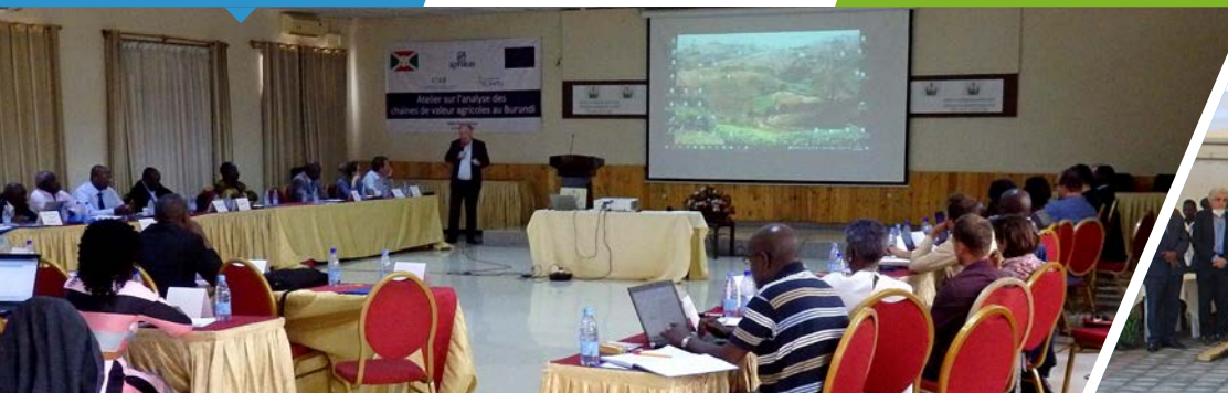
Réunion de restitution de l'Etude préalable