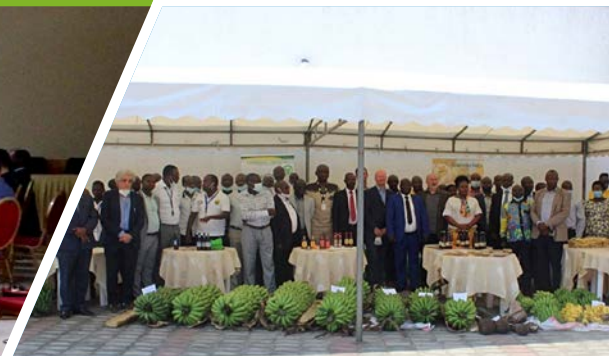
Lancement officiel de la plateforme