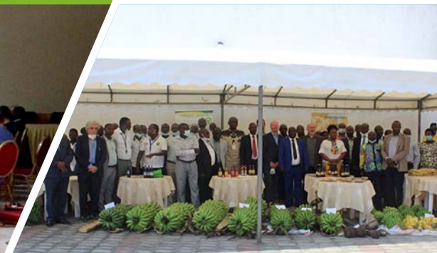
Lancement officiel de la plateforme